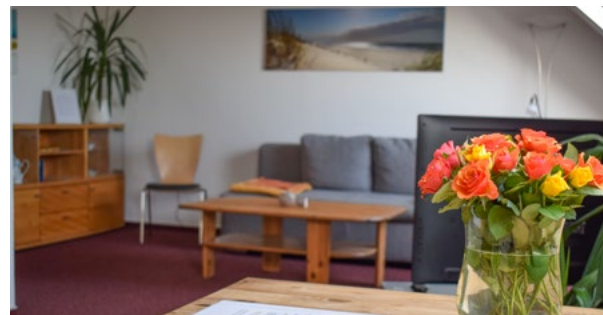
Beispiele unserer Wohnungen mit Schlafzimmer, Wohn-/Esszimmer und Küchenzeile.

„JUIST IST WIE EIN JUWEL“, MEINEN VIELE UNSERER URLAUBSGÄSTE, DIE JEDES JAHR WIEDER ZU UNS KOMMEN UND DIESE INSEL LIEBEN GELERNT HABEN.