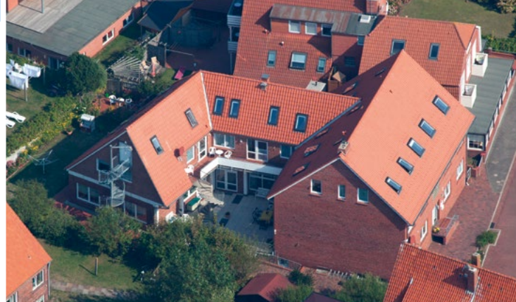
Unser Ferien- und Gästehaus aus der Luft fotografiert

„JUIST, DAS IST DIE SCHÖNSTE UNSERER OSTFRIESISCHEN INSELN“, BEHAUPTEN WIR OSTFRIESEN.