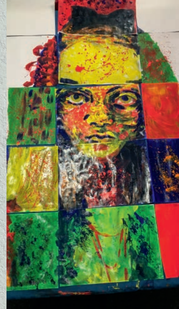
Abb. o.: Eins der entstandenen Collagen-Portraits

Für die Kinder, die zumeist aus schwieriger sozialer Situation stammen, hat eine solche Kunstaktion aber auch noch eine weitergehende Bedeutung. Selbstwertgefühl und Selbstbewusstsein werden gestärkt, indem etwas Eigenes entsteht, auf das man durchaus stolz sein darf. Und oft gelingt es durch die Kunst etwas auszudrücken, was verbal nicht ohne weiteres möglich ist. Pädagogisch wird das Projekt von Cordula Bächle-Walter begleitet, Distriktleitung Hohenlohekreis der Evangelischen Jugendhilfe Friedenshort (Region Süd). Wer die Kunstwerke betrachten will, hat ab 1. Juni 2018 hierzu erneut Gelegenheit. Dann ist »Welcome to my life« im Öhringer Rathaus zu sehen. Die Ausstellung läuft bis zum 12. Juli 2018. (hs)