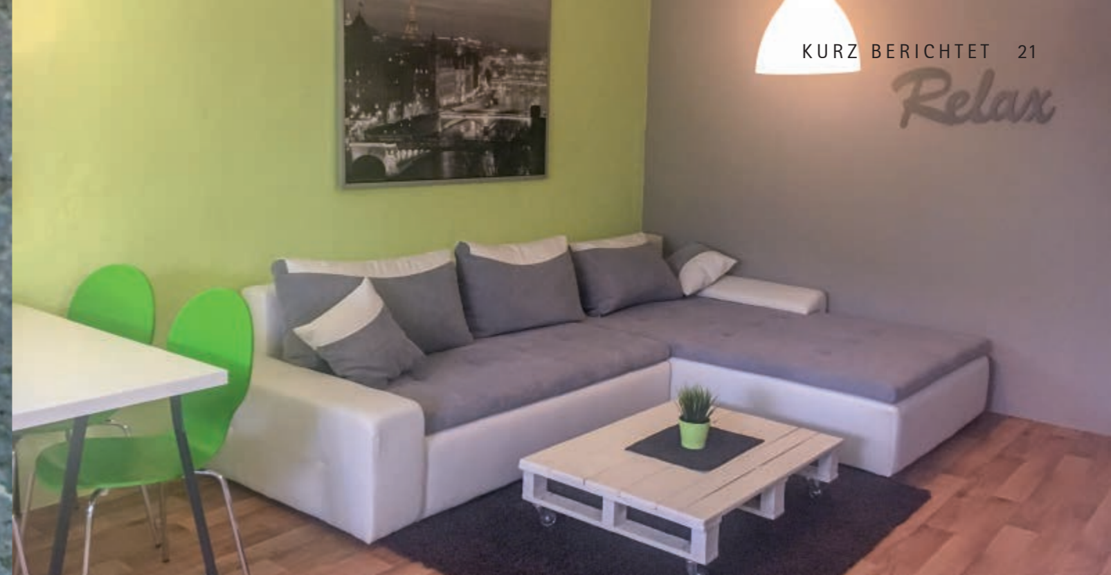
Vom Wasserschaden sind keine Spuren mehr zu sehen, die Gruppe freut sich über die frisch renovierten Räume.

Das Dennoch, das Paradox des christlichen Glaubens: Der leidet, wird auch gerettet werden; der am Kreuz stirbt, wird uns das Leben schenken; der zu einem schmachvollen Tod Verurteilte hat uns befreit, der Tod – vom Leben gezeichnet – verliert sein Gesicht.