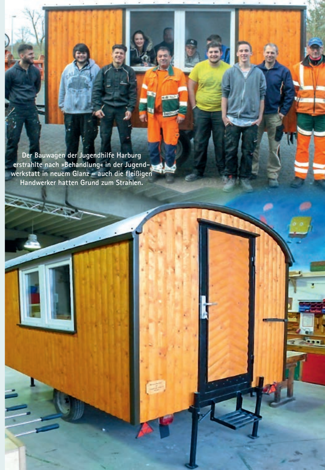
Der Bauwagen der Jugendhilfe Harburg erstrahlte nach »Behandlung« in der Jugendwerkstatt in neuem Glanz – auch die fleißigen Handwerker hatten Grund zum Strahlen.

Beim Projekt ist der Name Programm. Die Jugendwerkstatt ist betriebsnah ausgerichtet und vermittelt handwerkliche Fähigkeiten. »Wir haben zwei Anleiter, die nicht nur ausgebildete Tischler sind,