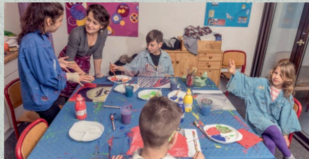
Abb. l.: Die Projektleiterin mit einigen der jungen Künstlerinnen und Künstlern