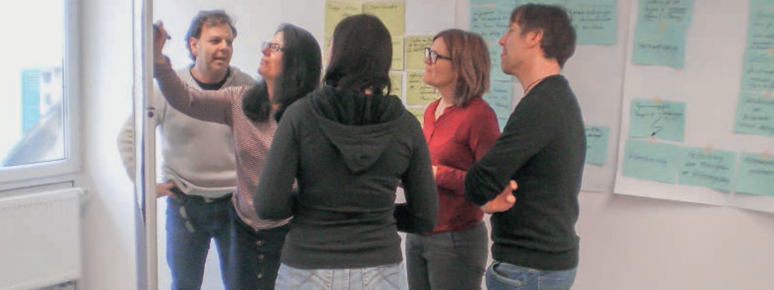
Abb. S. 34 Beteiligung und Partizipation der betreuten Kinder und Jugendlichen stehen im Fokus.