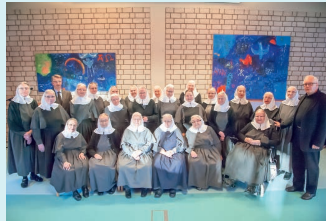
▼ Die Teilnehmerinnen zusammen mit dem Vorstand