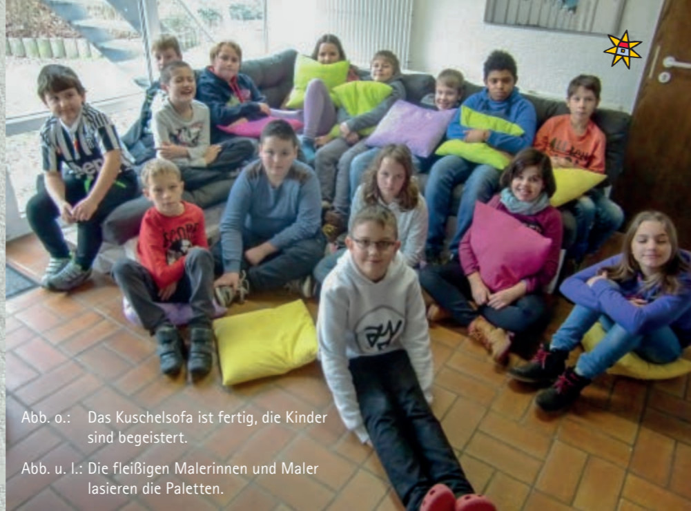
Abb. o.: Das Kuschesofa ist fertig, die Kinder sind begeistert.