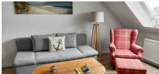
Beispiele unserer Wohnungen mit Schlafzimmer, Wohn-/Esszimmer und Küchenzeile

„JUIST IST WIE EIN JUWEL“, MEINEN VIELE UNSERER URLAUBS- GÄSTE, DIE JEDES JAHR WIEDER ZU UNS KOMMEN UND DIESE INSEL LIEBEN GELERNT HABEN.