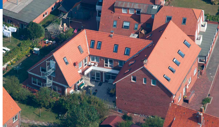
Unser Ferien- und Gästehaus aus der Luft fotografiert

„JUIST, DAS IST DIE SCHÖNSTE UNSERER OSTFRIESISCHEN INSELN“, BEHAUPTEN WIR OSTFRIESEN.